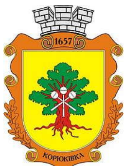
Герб м. Корюківка

розташоване за 100 км від обласного центру – м. Чернігова – у північній частині області, на березі річки Бреч (притока річки Снов). Місто знаходиться на перетині автошляхів обласного і місцевого значення, по яких здійснюється транспортний зв'язок з обласним центром та сусідніми райцентрами: Щорсом, Меною, Семенівкою і населеними пунктами району.